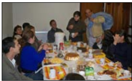
El papa Noel de la Amistad